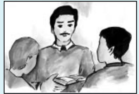
Bild 8: Im Gespräch mit Stefan

Martin hat eine Idee: „Komm, wir gehen zu Stefan, vielleicht kann er da weiterhelfen!“ Sie treffen ihren Jungscharleiter im Jugendkeller: „Wisst ihr“, erklärt er, „wenn wir Gott ungehorsam werden oder mit seinen Führungen unzufrieden sind, führt das zu Blockaden. Dann kann man zwar die Bibel aufschlagen, aber eigentlich will man gar nicht, dass Gott spricht. Man will sowieso nicht das tun, was er sagt oder schon gesagt hat. In solch einem Falle ist das Lesen nur eine fromme Pflichtübung. Da gibt es nur eines: Bekennen und Lassen! Kommt, wir lesen einmal gemeinsam I. Johannes 1 Vers 9 (Lesen Sie diesen Vers vor oder bitten Sie ein Kind darum) „Der Herr Jesus verspricht uns, dass er uns von aller Schuld reinigt, wir müssen ihn nur darum bitten.“, erklärt Stefan.