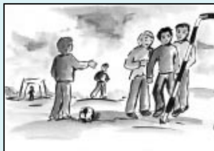
Bild 7: Fußballspiel