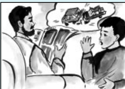
Bild 1: Martins Vater hört zu

Wie gut, dass sein Vater da ist! Er nimmt sich Zeit und hört ihm zu. Und so erzählt Martin von dem Unfall, der gerade in der Nähe geschehen ist ... Aber sein Vater hat nicht immer ein offenes Ohr für ihn. Dann geht Martin zur Mutter oder zu Thomas, seinem Freund. Manchmal hat er den Eindruck, alle haben wichtigere Dinge zu tun. Wie gut, dass Martin jemanden kennt, der immer Zeit für ihn hat: Gott, sein himmlischer Vater!