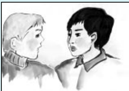
Bild 6: Martin und Thomas im Gespräch

„Was ist denn mit dir los?“ fragt Thomas, der sich über die schlechte Laune seines Freundes wundert.