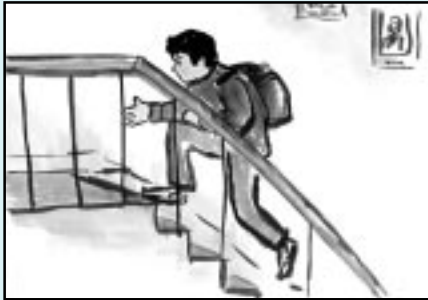
Bild 5: Martin rennt zur Schule

Martin rennt im Dauerlauf durch die Straßen und biegt um die Ecke. Da ist sie schon, seine Schule.