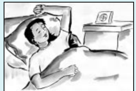
Bild 2: Martin streckt sich

Martin wacht auf und blinzelt. Die ersten Sonnenstrahlen kitzeln seine Nase. Aus der Küche dringt Geschirrkloppern an sein Ohr, und im Bad liefern sich seine Brüder eine Wasserschlacht. Martin streckt sich, steht auf und schlendert zum Fenster. Etwas frische Luft tut einfach gut.